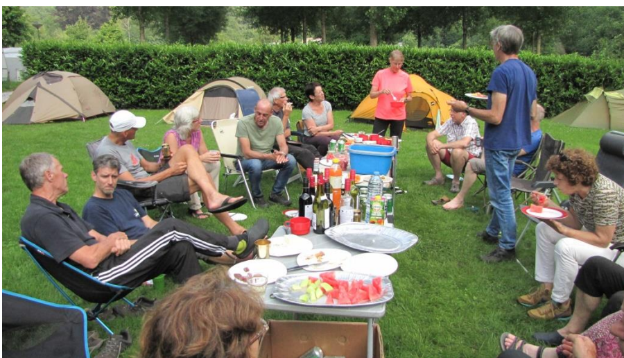
De borrel was weer rijkelijk voorzien van hapjes

Hoewel de gezellige borrel op zaterdagavond niet maaltijdvervangend was, hebben weinig deelnemers na afloop de moeite genomen om nog te gaan eten.