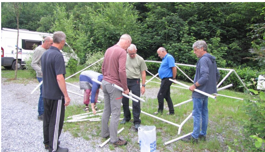
Het opzetten van onze tent, een overbodige actie

De weersvooruitzichten waren niet zo best: het hele weekend was er kans op regen. We hebben daarom de grote 50 Plustent opgezet, zodat we daarin zouden kunnen schuilen. Gelukkig dreven de buien langs ons klimgebied in Durnal en zorgde de bewolking voor een aangename klimtemperatuur.